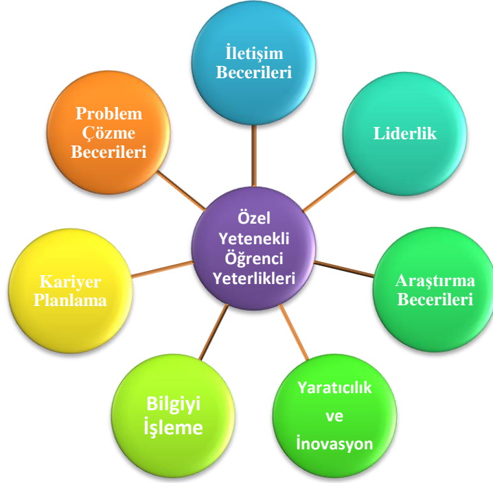
Şekil 1. Çerçeve Programın Yeterlik Alanları

Bu programda, özel yetenekli bireyin ortaöğretimden mezun oluncaya kadar sahip olması gereken yedi yeterlik alanı belirlenmiştir. Bu yedi yeterlik alanının birbiriyle nasıl ilişkilendirileceğini Şekil 2’deki gibi bir araya getirerek görselleştirmek, özel yetenekli bireylerin eğitiminin birçok yönünün ele alınmasını sağlar. Burada yeterlik alanlarının ilişkilendirilmesi üçlü gruplar halinde verilmesine rağmen daha da fazla olabilir. Bu modeldeki gruplamalar farklılaştırmanın içerik, süreç, ürün ve öğrenme ortamı boyutları dikkate alınarak yapılmıştır. Bu gruplamalardan birinde içerik, süreç, ürün boyutunda farklılaştırma yapılırken, bir diğerinde süreç, ürün ve öğrenme ortamı boyutlarında farklılaştırma yapılmıştır. Böylece bu boyutlar dikkate alınarak yapılan ilişkilendirmelerde program yetenek alanlarının birbiriyle etkileşimi sağlanır. Burada dikkat edilmesi gereken nokta öğretmenin yapacağı etkinlikte tüm boyutları göz önünde bulundurması gerekmez. Bazen sadece süreçte farklılaştırma yapılabilirken bazen ise üründe farklılaştırma ya da her üç boyutu dikkate alarak bir farklılaştırma yapılabilir. Bu model öğretmenin çerçeve programın tüm yeterliklerini yapacağı etkinliklere yedirerek vermesini kolaylaştıran bir model olarak görülebilir. Her bir yeterlik alanı birçok kez kullanılabilir.